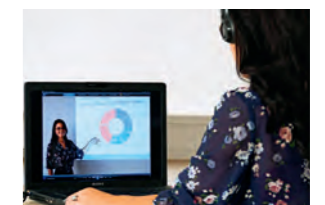
Live-Präsentation, Hauptraum Videoanalyse, Nebenraum