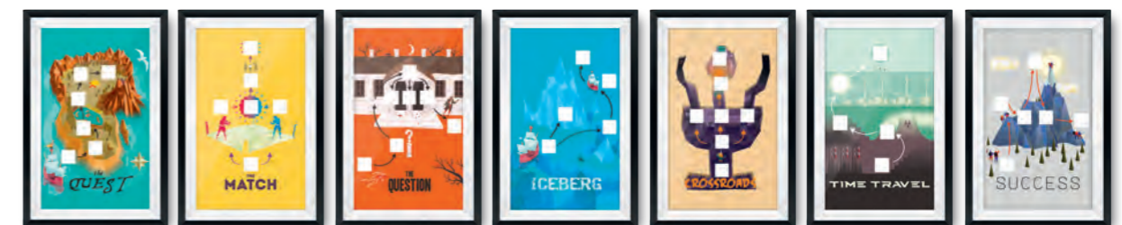
HPS Storyboards: Ihr roter Faden für beeindruckende Präsentationen

➔ Dieses Training können Sie auch in Englisch (Storypresenting®) buchen.