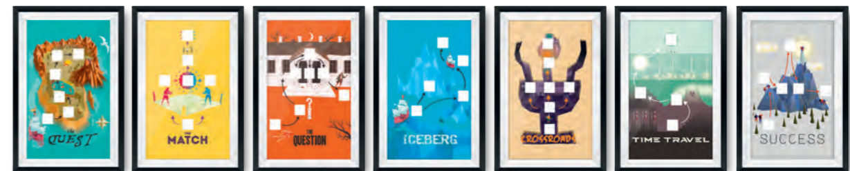
HPS Storyboards: Ihr roter Faden für beeindruckende Präsentationen